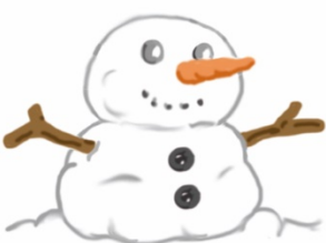
MUÑECO DE NIEVE